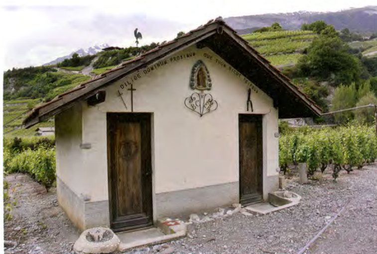
Guérite « patrimoine » à Vens, au fond du Schourby.

Invitation cordiale Fondation Bretz-Héritier