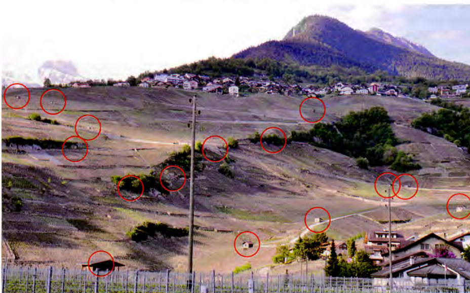
Vignoble sous Chandolin, 16 guérites encerclées.

trois grottes, deux guérites en métal et quatre abris. Parmi les ouvrages en maçonnerie sont regroupées les guérites aux façades en plots, avec ou sans crépis, quelques-unes ayant des éléments de béton. La dalle en béton, en guise de toit, est fréquente, tout comme les toits à un seul pan, dit toits de moulin, recouverts de tôles ondulées, de tôles ondulées éternit, de tuiles ou, parfois, de carton bitumé. Les toits à deux pans des guérites de style maisonnette ont également ces types de couverture. Les guérites sont encore relative-