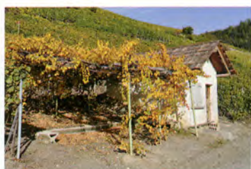
Divers types de construction.