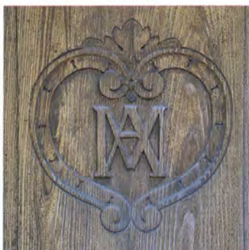
Monogramme AM, Ave Maria, porte de l'ancienne église de Plan-Conthey.