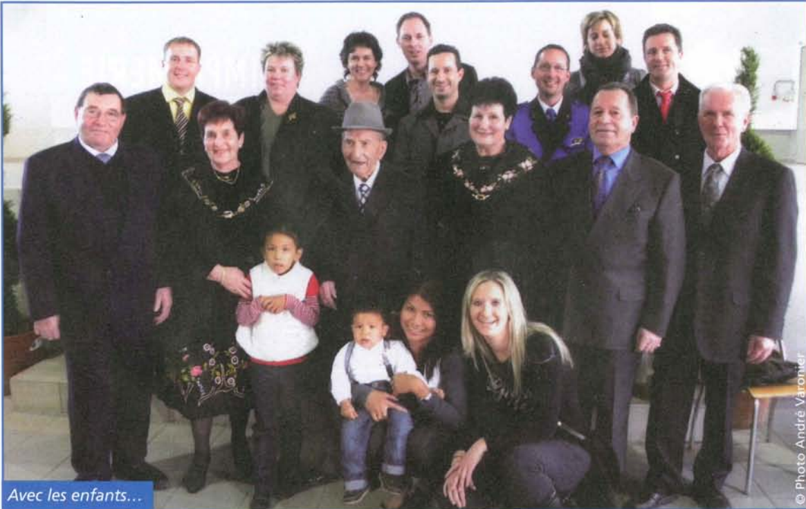
Avec les enfants...