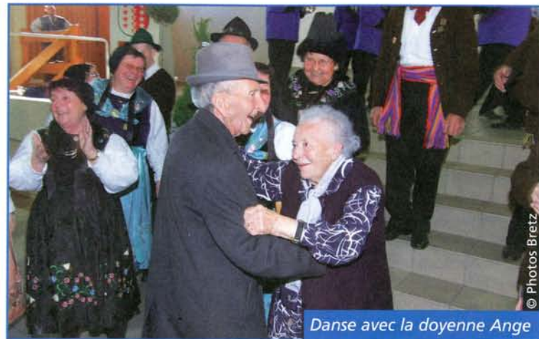
Danse avec la doyenne Ange

Ce soir, nous rentrerons chez nous par le même chemin, mais transformés, illuminés, davantage conscients que l'or de la vie est un don, l'encens de la mémoire un bien pour toute une commune au fier patrimoine, comme les racines sont le grand bien pour tout l'arbre, et la myrrhe de la sagesse une route sur laquelle on trouve les meilleures balises, que les moins de cent ans ont raison de suivre!» A la sortie de l'église, le centenaire, né le jour de l'Épiphanie, était attendu par les trois Rois mages saviésans.