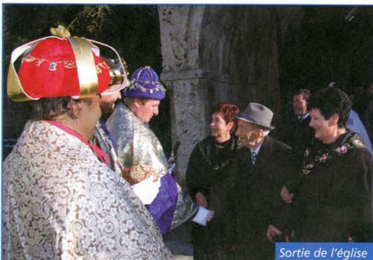
Sortie de l'église