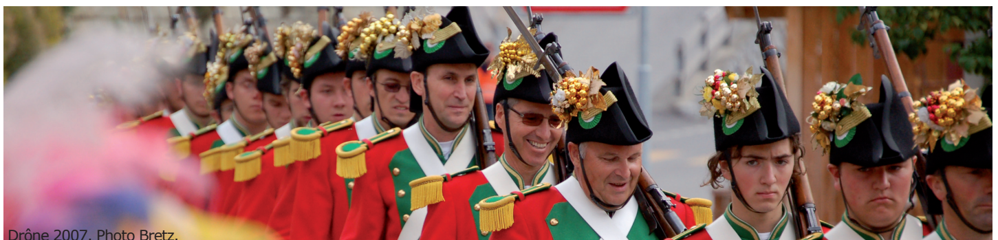
Drône 2007.

Un document proposé par la Fondation A. et N. Bretz-Héritier, Savièse, 2017. fondation@bretzheritier.ch www.bretzheritier.ch